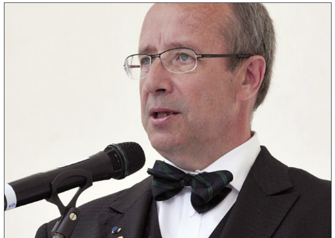
President Toomas Hendrik Ilves kõnelemas.

Seetõttu on see teema ja ka teie saatus mulle isiklikult vägagi lähedane. Kõik need julmused pidid sünnitama hirmu. Julmus prõmmis kõikide Eesti kodude ustele, kurjus hakkas murdma kõiki südameid. Kuid hirm ei suutnud hävitada mälu ja lootust. Teie usk vabadusse andis Eestile võimaluse taastada iseseisev riik.