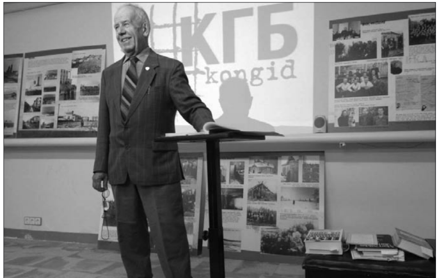
Kõneleb vabadusvõitleja Mart Niklus