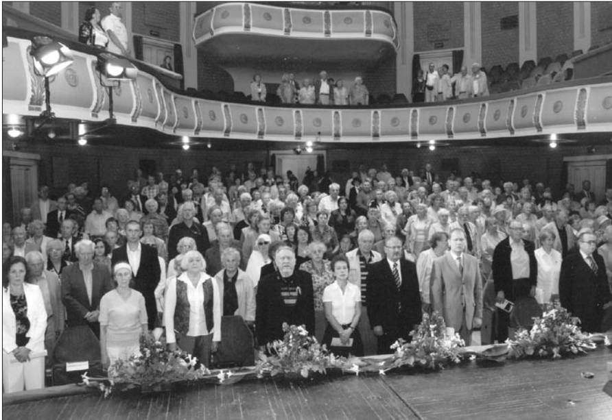
Korraldajad: Eesti Memento Liit, Eesti Rahva Muuseum, Eesti Rahva Muuseumi Sõprade Selts ja Eesti Kultuuriseltside Ühendus alustasid kokkutulekut Vanemuise teatri väikeses majas Tartus leinaseisakuga.