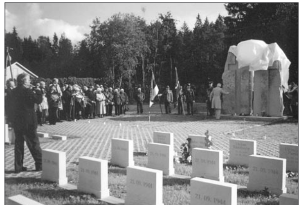
Vistla memoriaali avamisel, Porkuni lahingupaigas 21.09.2008

Tööpataljonlaste Ühingu juhatuses esimees