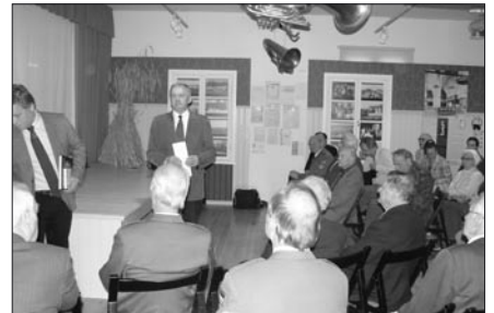
Seminaril Harjumaa muuseumis Keilas