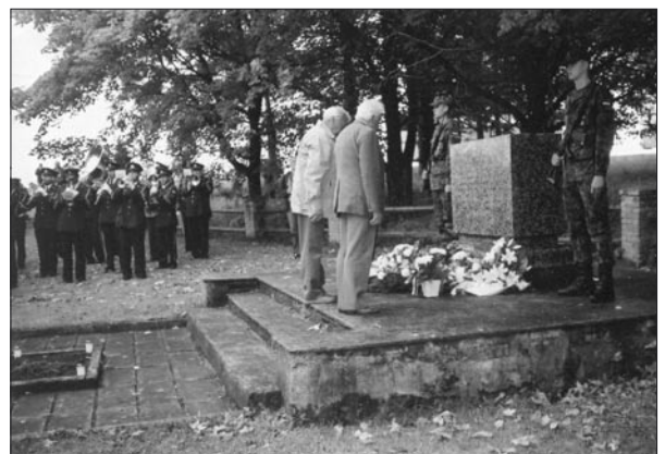
Mälestuslillede asetamisel Loksa vennashaual 21.09.2009