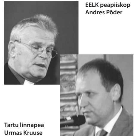
EELK peapiiskop Andres Pöder