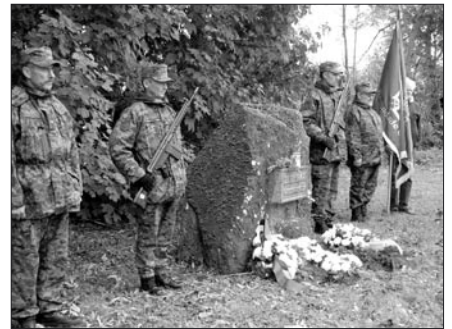
21. septembril 1944.a. toimunud Keila lahingu meenutusradadel Kumnas 24.09.2011.a.