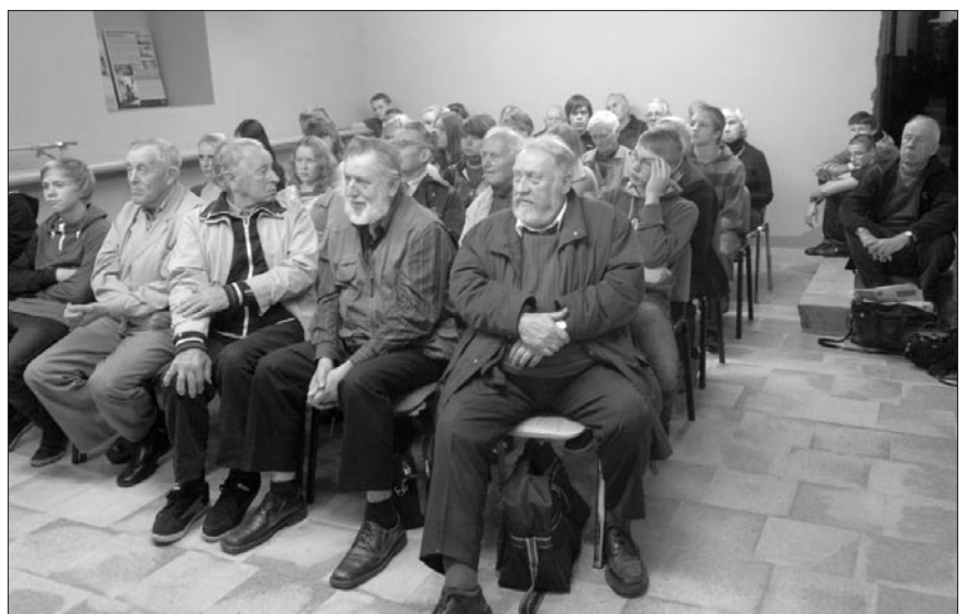
Vaade saali