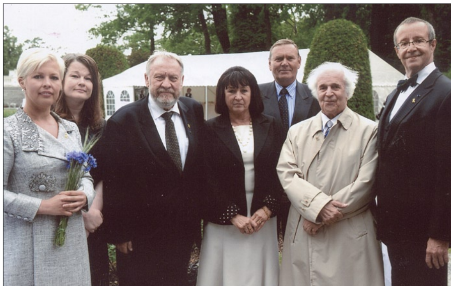
Presidendi vastuvõtt Kadrioru Lossi Roosiiaias 14. juunil.