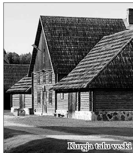
Kurgja talu veski tulid tööpoolest alles selle liitmise järel Vändra sovhoosiga.

31. oktoobril 1940 vormistati talu tükeldamine. Jakobsoni tütardele jäi 30 ha, ülejäänust loodi kaks uusmaak kohta ja anti üks juurdelõige, 12 ha metsa riigistati. Iseloomulikult 1940.a. maareformile oli maade jagamine ebaõiglane senise omaniku suhtes: ära võeti paremad maad, alles jäetud maast ei piisanud talu 16-pealise tõukarja pidamiseks. 1942.a. veebruaris tagastati talu omanikele, kellele see jäi kaheks ja pooleks aastaks kuni nõukogude maareformi taaskeshtamiseni 1944.a. sügisel. Talu likvideeriti lõplikult 1948. a. ja sellest saigi "ajalooline mälestuse" – kiratsev kohalik väikemuuseum, mille paremad päevad