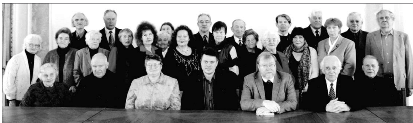
23. märtsil täiendasid IRL ja Memento koostöölepet aastateks 2010-2011.