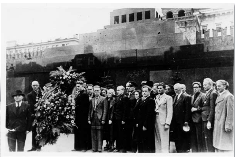
Eesti delegatsiooni liikmed, kes käisid Moskvast NSV Liiduga ühendamisvormistamas, pärjaga Punasel väljakul Lenini mausoleumi ees.