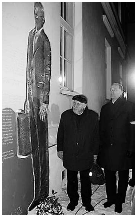
2. veebruaril 2010 avati Tartu rahu majal Jaan Poska bareljeef koos Tartu rahu II peatiikiga eesti ja vene keeles.

2. veebruaril 1990 paigaldasid Tartu Memento, Tartu Muinsuskaitse Ühendus ja kaitseliitlased Tartus Tartu rahu majale Vanemuise tn. 35 kaks plaati (eesti ja vene keeles) mälestamiseks 70 aasta möödumist Tartu rahu lepingu sõlmimisest.