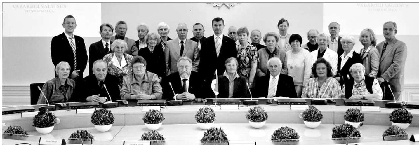
25. mail arutati Stenbocki majas Reformierakonna ja Memento koostööleppe täiendamist. Leppele kirjutatakse alla juunikuus.