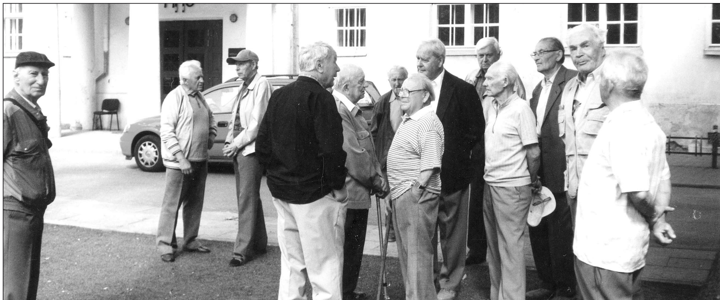
Endised tööpataljonlased kokkutulekul Tartus 3. juulil 2005.