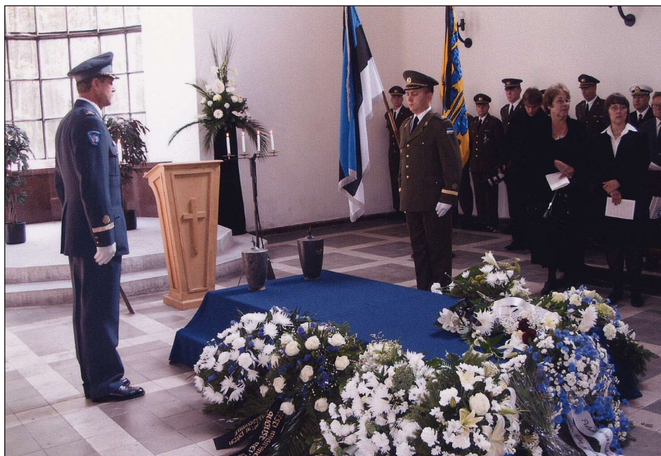
Tseremoonia algus Metsakalmistu kabelis.