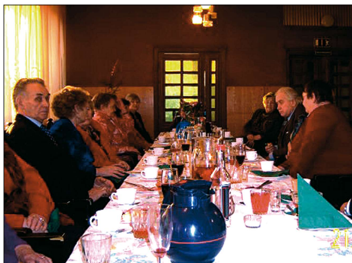
Rakvere mementolased jõululauas 2007. aasta lõpus.

Eesti Memento Liit soovib kõigile ilusat jätkuvat vabariigi juubeliaastat!