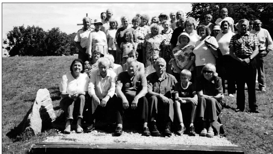
2007. aasta suvel Sinimägedes.

Valgamaalaste jaoks ja ka isiklikult enda jaoks pean aga kõige tähelepanuväärsemaks teoks seda, et oleme