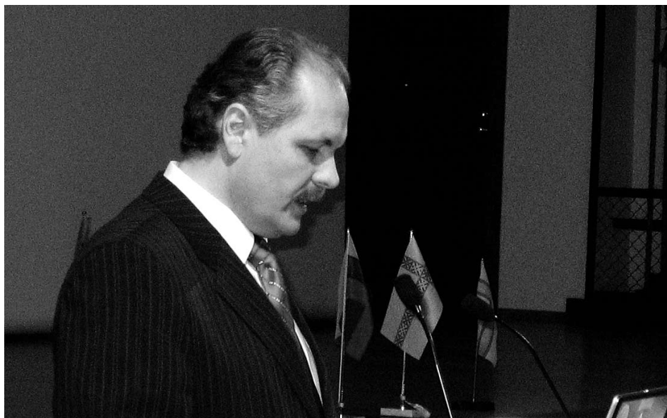
Artikli autor kõnelemas konverentsil "Tartu Rahu ja tänapäev".

Võib-olla oleme üldisematelt prob- leemidelt pöördunud veidi enam päe- vakajalistele küsimustele, kuid poliiti- line olukord ja sündmused ise on seda dikteerinud. Kuna Koostöökoja kogu tegevuse kajastamiseks jääb artikli maht väikeseks, siis toon vaid mõned näited meie 2007. aasta tegemistest. Koostöökoja tagantõukamisel andis Eesti Post välja küüditamisteemalise postmargibloki, ümbriku ja kaardi. Sellel on ära toodud andmed kõigi