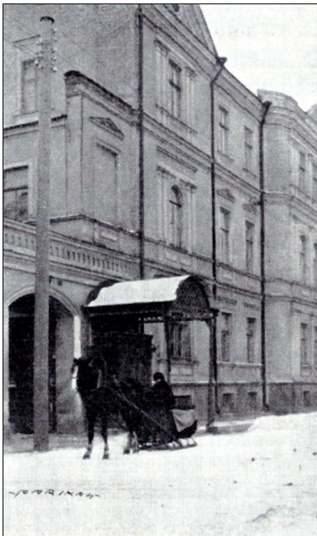
Maja, kus toimusid Tartu Rahu läbirääkimised.