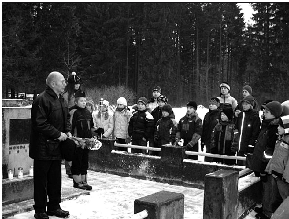
Leinatalitus Tõrma Punase Terrori Ohvrite mälestusmärgi juures.

Veebruarikuu juhatuse koosoleku päevakord oli üsna lühike ja vaid põhiprobleeme kajastav. Kõik tavapärase meelelahutusliku jätsime ära, sest meie üht liiget oli tabanud suur mure, ta kodus oli olnud tuleõnnetus. Läbi said arutatud 24. veebruaril Rakvere Linnavalitsuse mälestusüritusel ja 1. märtsil Rakvere Rahvamajas Eesti Vabariigi juubeliaasta tähistamisel osalemine, osavõtt algaval teatrikuul märtsiküüditamise aastapäeva tähistamiseks toimuvast etendusest "Niskamäe naised". Lisaks igakuistele juhatuse koosolekutele on esimesel poolaastal kavas veel märtsis küüditamise aastapäeva tähistamine, jüripäeval Riigikogu