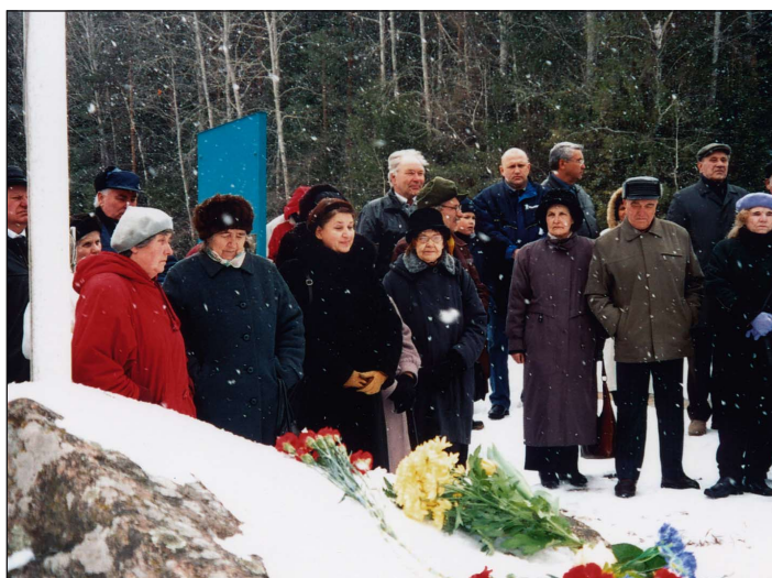
Märtsiküüditamise mälestamine Keeni raudteejaamas Valgamaal.