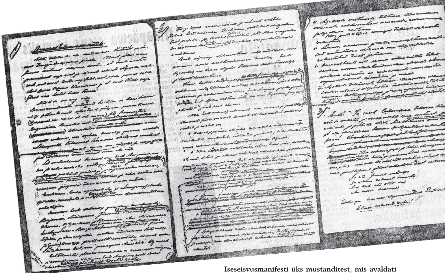
Iseseisvusmanifesti üks mustanditest, mis avaldati 24. veebruari 1928. aasta Päevalehes

Kahjuks ei ole manifesti algtekste enam alles või on teadmata kohas. 24. veebruari 1928 "Päevalehes" avaldati üks mustanditest, mille siinjuures taas ära toome.