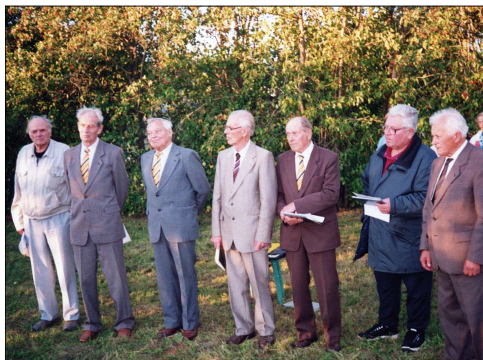
Tööpataljonlaste ühendus Rägaveres Eesti Vabadussõjas langenute mälestusmärgi juures.