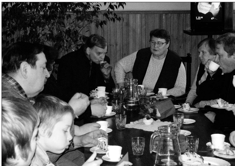
Pärast leinatalitust istuti ühiselt laua ääres.

külastamine ning maikuu lõpunädalal – kui meie projekte ikka rahastatakse – Lääne-Virumaa gümnaasiumiõpilaste ja represseeritute ühingute liikmete ühine ekskursioon Tallinna kohtusesse ja Eesti Panka ning kas Tallinna katakombidesse või juudi süngagoogi. Mais peame ka üldkoosoleku, kus lisaks majandusaasta aruande kinnitamisele on kavas põhikirja ja ühingu nime vastavusse viimine seadusesätetega ja