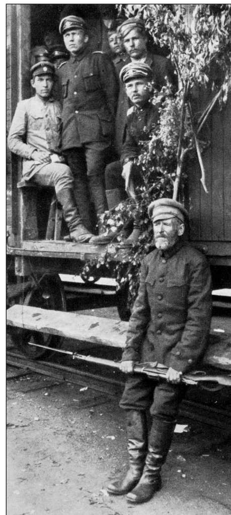
Rong viib sõdureid võitlusesse Landeswehri vastu. Esiplaanil elatanud vabatahtlik.

Vabadussõja võit on nõudnud meie rahvalt suuri ohvreid ka pärast seda, kui 3. jaanuaril 1920 vaikusid relvad. Seda, mida ei suudetud ausas lahingus rindel korda saata, hakati teostama suure impeeriumi kättemaksuna pärast 1940. a. toimunud okupatsiooni. Sõnamurdlikult Eestisse tunginud okupatsioonivõim hakkas esimeste seas vahistama ja hävitama Vabadussõjas võidelnuid: riigijuhte, ohvitseri, rahvaesindajaid parlamendist ning omavalitsustest, haritlasi ja seejärel kõiki neid, kes polnud