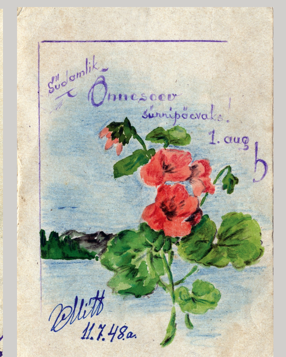
Pildid on joonistatud Bogoslovlagis Sverdlovski obl trükitud, margiga varustatud ametliku postkaardi kirjaküljele ja saadetud abikaasale ning tütrele Eestisse. 1. Mai oli pulmapäev