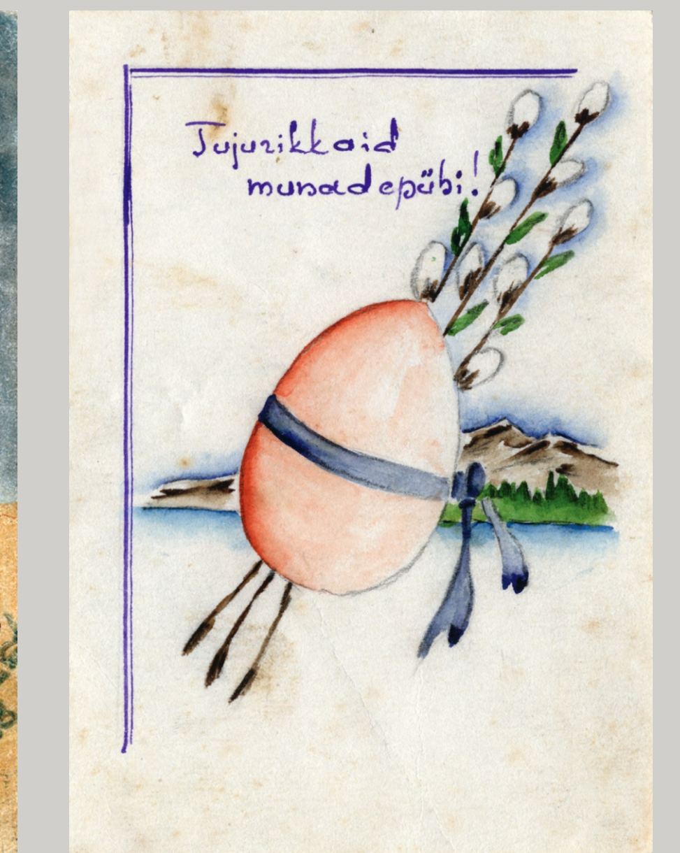
Pulma-aastapäevaks ja munadepühadeks kodustele joonistatud kaardid, 1948