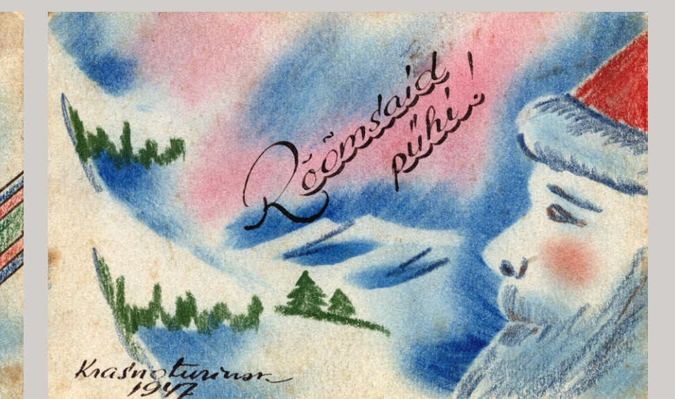
Uuralis Krasnoturinskis Bogoslovlagis joonistatud kaardid, saadetud Eestisse üheksa-aastasele tütrele 1947