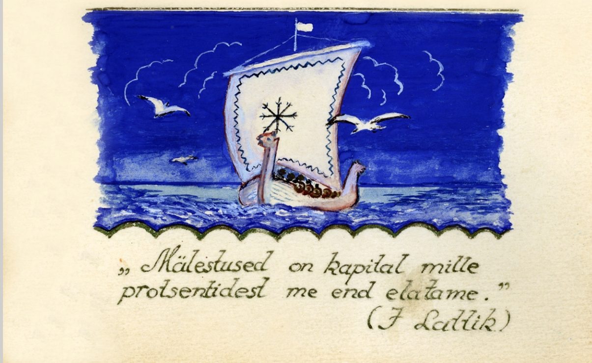
Mõlemad akvarellkaardid valmisid 1956-1957