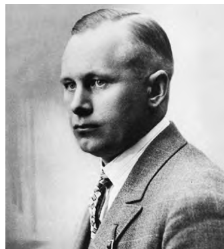
Otto Tief (1889–1976), Eesti poliitik ja sõjaväelane, Vabariigi Valitsuse moodustaja ja peaministri asetäitja 1944. aastal.

Vastupanuvõitluse päeva tähistati paljudes kohtades üle kogu Eesti.