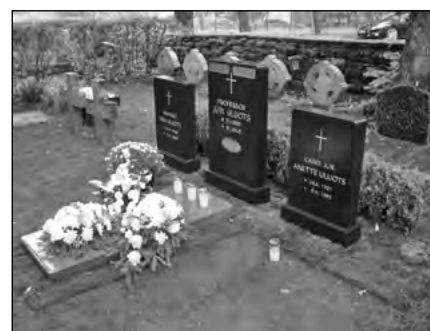
Üks selle päeva traditsioonidest, lilled Jüri Uluotsa hauale.