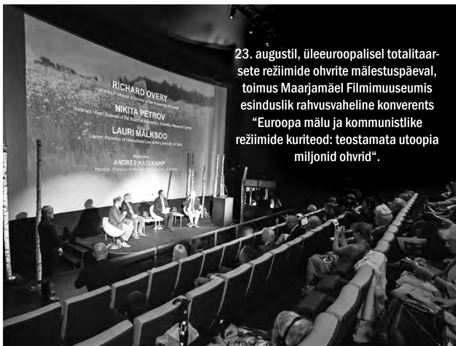
23. augustil, üleeuroopalisel totalitaarsete režiimide ohvrite mälestuspäeval, toimus Maarjamäel Filmimuseumis esinduslik rahvusvaheline konverents “Euroopa mälu ja kommunistlike režiimide kuriteod: teostamata utopia miljonid ohvrid”.