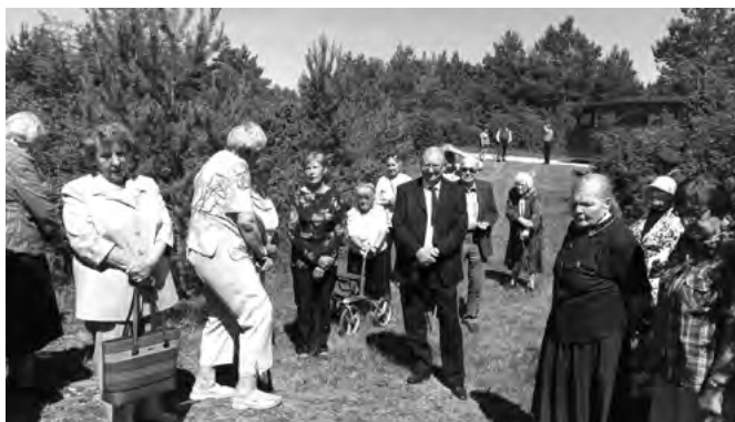
Saaremaa mementolased kogunevad leinapäeval.

Tahaks loota, et sellega on tänavused Saare maakonna Memento ühenduse ettevõtmised õnnestunud lõppenud. Aga vist pole sõna "lõppenud" kohane, kuna töö valdade juhtkondadega käib ikkagi edasi. Tulevad aastavahetuse peod ja vastuvõttud, liiguvad mõtted järgmise aasta peale, mil täitub 70 aastat märt-