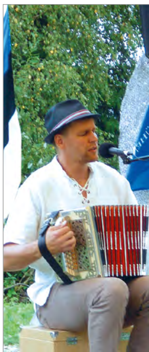
Pilistvere fotod: Memento Teataja kogu