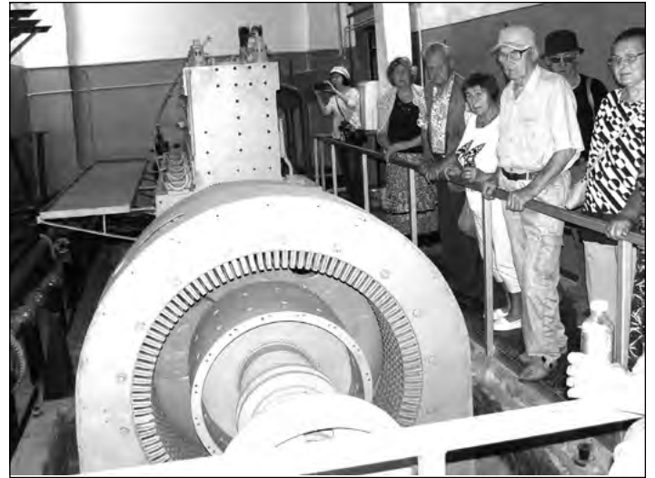
Plokštiene tuumabaasi elektrijaam.

Järgmine peatus – Telšiai rajooni Rainiai memoriaal – masendas meid aga veelgi rohkem. Külaäärsel künkal seisev väike valge 1992. aastal ehitatud kabel meenutab 1941. aastal tapetud 76 meest, kellest noorim oli vaid 16-aastane. Kabeli sein- ja laemaalid kajastavad leedu rahva ränka saatusi okupatsioonivõimude ajal. Maalidel on kujutatud metsavendade karmi elu, Siberi-aastate nälga ja viletsust, inimeste hukkamist. Üks maal aga näitab ka hukkajate metsistunud nägusid oma julmuse toimepanekul. Üle selle kõige on aga Jumal, kes näeb seda kõike ja mõistab õiglast kohut. Kabeli keldriruumi on kujundatud väike muuseum, kus on