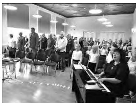
Aktusel Ridala koolis kõlavad isamaalised laulud.