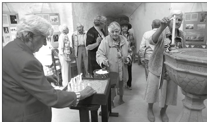
Mälestusküünlad sümboolsele hauale.