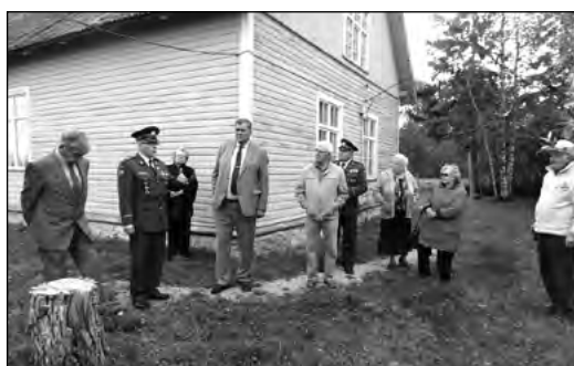
Mälestushetk Põgaris palvemaja juures, kus peeti viimane O. Tiefi valitsuse istung.

Puiste rand, kus oodati põgenemiseks paate. Maailma lõpp, kust edasi ei saanud. Sellel väljal läksid paljud inimesed vabasurma.